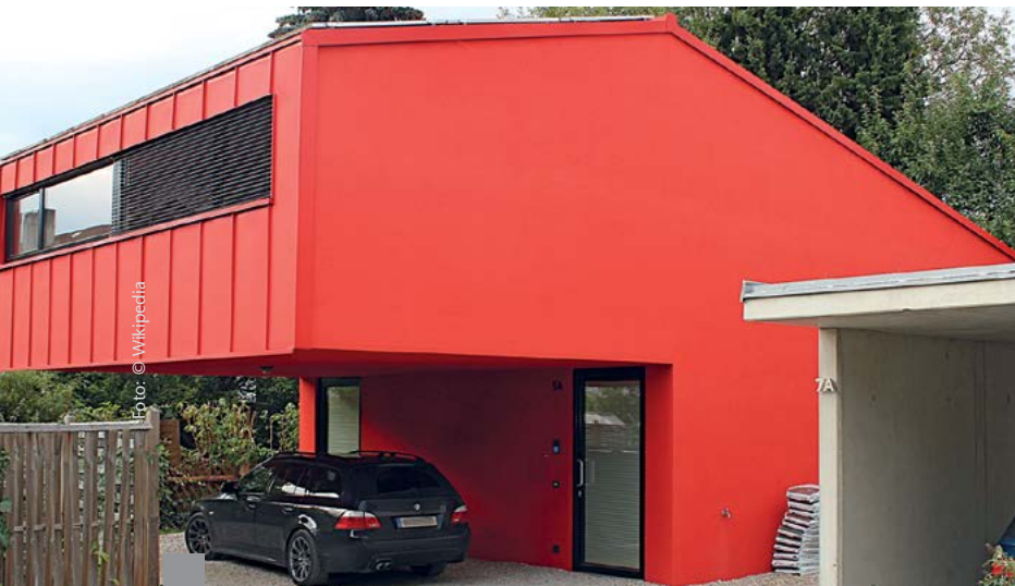
Hier und dort gibt es schon Smart Homes: Das Haus V in Unterföhring wurde als Smart Home von Frank Völkel konzipiert, die Bauausführung hatte das Architekturbüro Jakob Bader in München.

Das Smart Home ist keine ferne Zukunft mehr: Die Mehrheit der erwachsenen Bundesbürger, 65 Prozent, möchte in fünf Jahren in einem intelligenten Haus wohnen. Sie verspricht sich davon ein angenehmeres und leichteres Leben. Die integrierte, vernetzte Technik steuert das Raumklima und merkt, wann und in welchem Raum Wärme oder Kälte gebraucht wird. Die Heizung fährt sich automatisch hoch oder runter, der Herd „weiß“, was im Kühlschrank steht, und schlägt passende Rezepte vor, ein zentraler Medienserver versorgt jeden gewünschten Raum mit Filmen und Musik. Der Wunsch nach Bequemlichkeit durch Technik rangiert quer durch alle Altersgruppen an erster Stelle noch vor dem Wunsch nach dem Zusammenleben mit einem Partner oder der Familie und dem Besitz eines Eigenheims. Das sind die Ergebnisse der repräsentativen Studie „Wohneigentum und Baufinanzierung“. Die höheren Kosten, die ein Smart Home zunächst verursacht, lassen sich zum Teil durch Einsparungen, beispielsweise beim Energieverbrauch, wieder hereinholen.